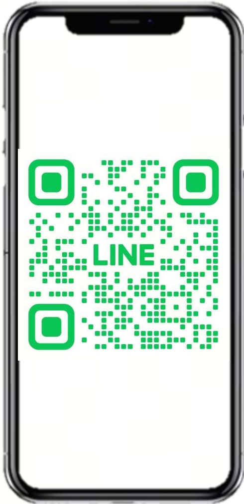
LINE Official Account